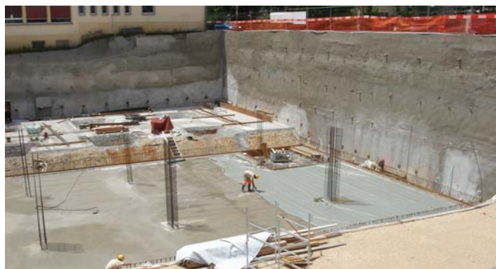
Terrassement, paroi clouée

Projet : 2008-2009 Réalisation : 2009-2010 Coût HT Fr. 3'570'000.- (terrassment structures porteuses et charpente)