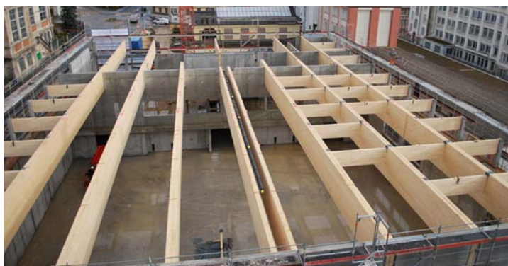
Charpente en cours de réalisation

Projet de l'ouvrage Appels d'offres (marchés publics) Projet d'exécution Exécution de l'ouvrage - Terrassement blindage de fouille - Béton armé - Charpente et dalles bois de toiture