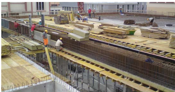
Dalle sur -1, vue sur sommier

Entreprise : Von Arx SA, Peseux : terrassements Bieri-Grisoni SA – Paci SA : maçonnerie, béton armé Charpente Vial SA, Le Mouret : charpente